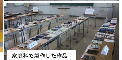
家庭科で製作した作品

11月7日(金)に、2・3年生の「組曲」の取組を中心とした授業研究の公開研究会を行いました。町内外から約100名の先生に参加していただき、2・3年生が学んだことや身に付いたことを見てくださいました。2・3年生がしっかり考えて堂々と表現している姿に多くの先生が驚き、喜んでおられました。ありがとうございました。