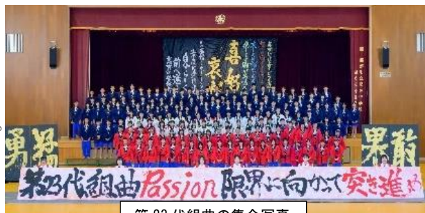
第23代組曲の集合写真

3年生はこの経験を次のステップに生かしましょう。1・2年生の来年度に期待しています。