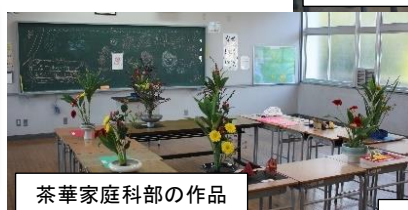
茶華家庭科部の作品

11月7日(金)に、2・3年生の「組曲」の取組を中心とした授業研究の公開研究会を行いました。町内外から約100名の先生に参加していただき、2・3年生が学んだことや身に付いたことを見てくださいました。2・3年生がしっかり考えて堂々と表現している姿に多くの先生が驚き、喜んでおられました。ありがとうございました。