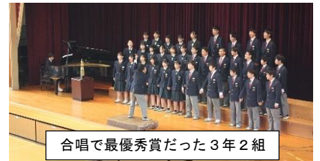
合唱で最優秀賞だった3年2組